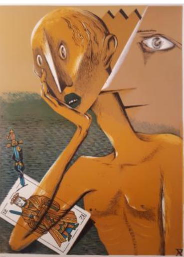
Grabado de la serie Los Reyes , de Pompeyo Audivert (1900/1977)

“Las máscaras vendrán a ti, el alma nunca está desnuda” Lady Macbeth