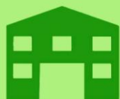
Tabla 6: Casos con vacantes asignadas